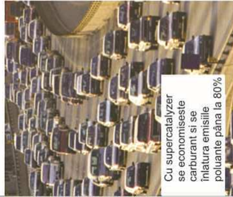
Cu supercatalyzer se economisește carburant și se înalță emisiile poluante până la 80%