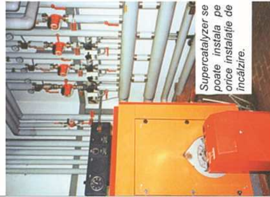
Super catalyzer se poate instala pe orice instalație de încălzire.