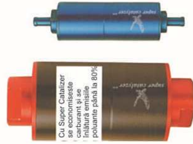
Cu Super Catalyzer se economisește carburant și se înalță emisiile poluante până la 80%